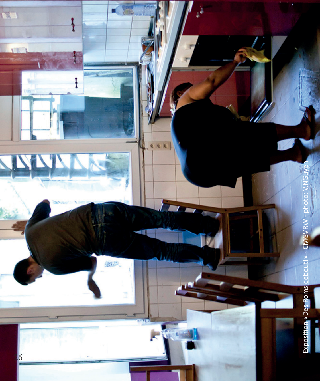
Exposition «Des Roms debout!» - CMIG/RW